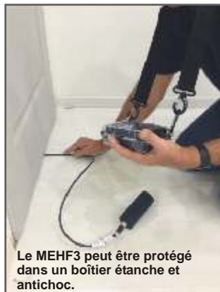
Le MEHF3 peut être protégé dans un boîtier étanche et antichoc.