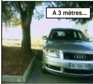
A 3 mètres...