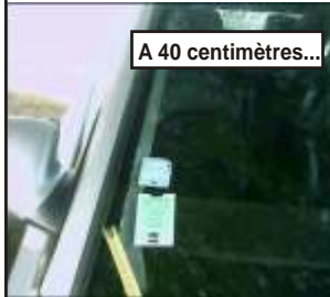
A 40 centimètres...