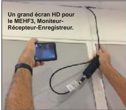
Un grand écran HD pour le MEHF3, Moniteur-Récepteur-Enregistreur.

Avec une longueur, un diamètre et une résistance équivalents à celui de la Z5, le câble de la Z6HD est aussi simple à manipuler, avec une mémoire de forme efficace sur toute sa longueur.