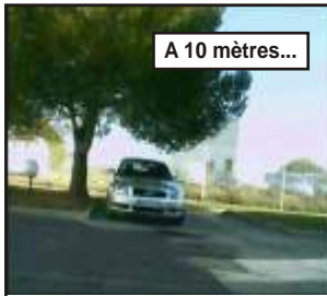
A 10 mètres...