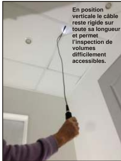
En position verticale le câble reste rigide sur toute sa longueur et permet l'inspection de volumes difficilement accessibles.

A l'écoute des utilisateurs (police, douane, gendarmerie, Forces Spéciales...) JCM a amélioré les performances de la Z6HD par rapport à la Z5, notamment :