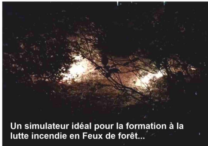
Un simulateur idéal pour la formation à la lutte incendie en Feux de forêt...