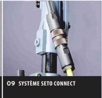
09 SYSTÈME SETO CONNECT