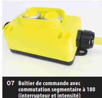
07 Boîtier de commande avec commutation segmentaire à 180 (interrupteur et intensité)