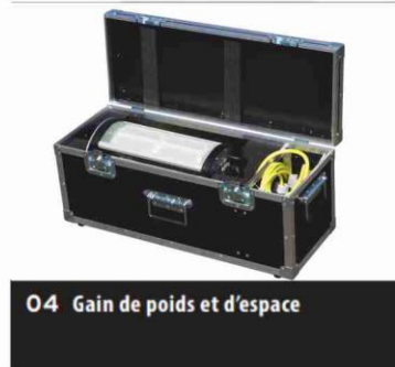
04 Gain de poids et d'espace