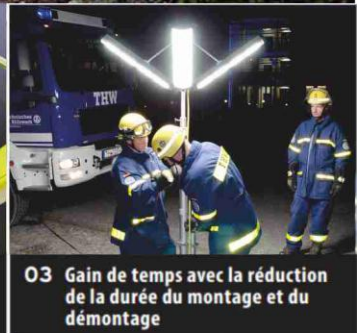
03 Gain de temps avec la réduction de la durée du montage et du démontage