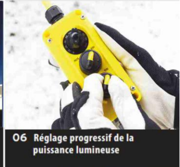
06 Réglage progressif de la puissance lumineuse