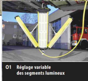
01 Réglage variable des segments lumineux