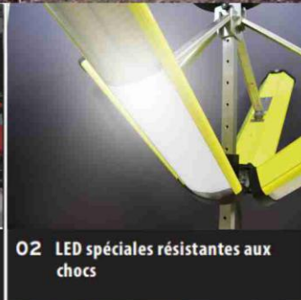
02 LED spéciales résistantes aux chocs