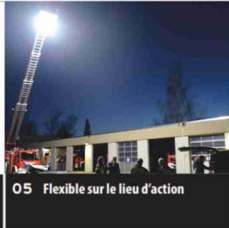
05 Flexible sur le lieu d'action