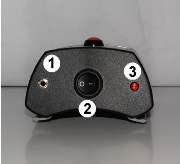
Illustration 3.1 : Unité stagiaire Misty : vue du dessus

Les illustrations 3.1 et 3.2 représentent les raccordements et éléments de commande de l'unité stagiaire Misty.