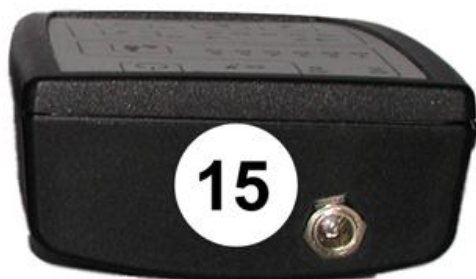
Illustration 3.5 : Connecteur de charge de l'unité instructeur Misty